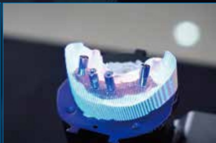
Мост на имплантах