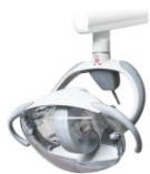
Лампа (Faro EDI LED)